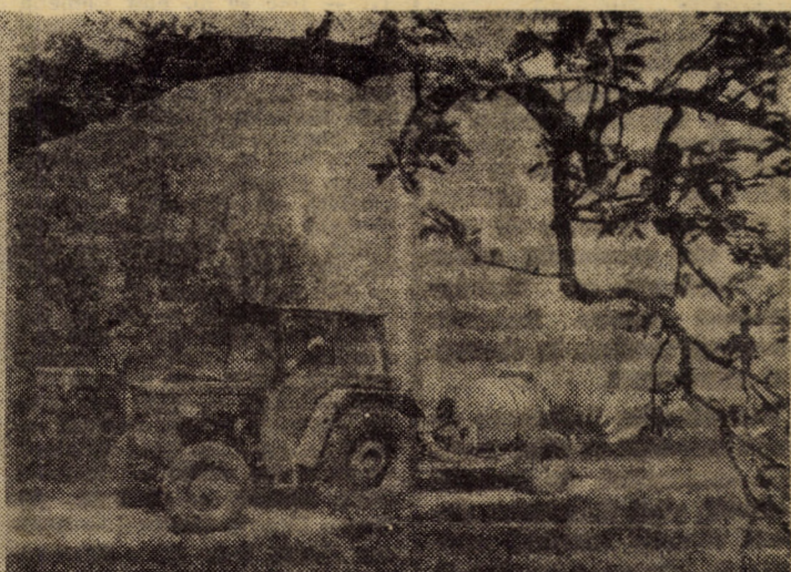
mare”, pe o suprafață de 35 hectare au fost plantați cca 150.000 sapa mare cu un efectiv zilnic de 200 oameni. În dreapta: Ferma care 20 hectare plantație modernizată, se execută stropitul post