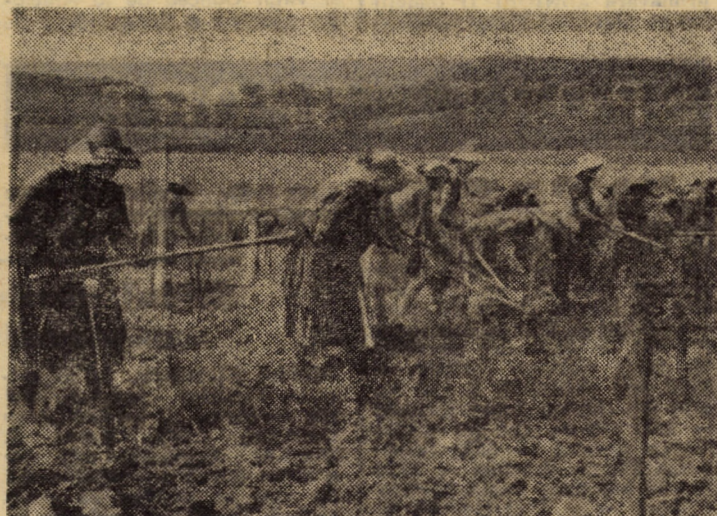
I.A.S. DUMBRĂVENI. În stînga: la Ferma Nr. 2 viticolă, în „Dricul butuci de viță de soiuri superioare la care, în prezent, se execută Nr. 3 horticolă, Hoghilag. Pe cele 125 hectare de livadă, din

primat într-o cameră a amortizorului. De remarcat că, deși, experimentările au aflate în curs se fac pentru Dacia 1300, soluția poate fi adaptată practic la toate tipurile de mașini. Încercările vor continua — potrivit afirmației specialiștilor sibieni — în tot cursul anului viitor.