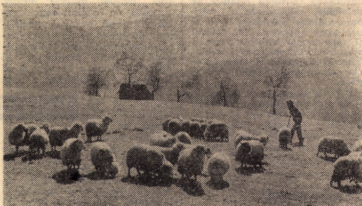
„Pe-un picior de plai, Pe-o gură de rai...”

Recomandăm încheierea acestei asigurări de către membrii cooperatori, în această perioadă când la nivelul fiecărei comune continuă acțiunea de încasare a taxelor de pășunat și de încheiere concomitentă a asigurărilor facultative de animale.