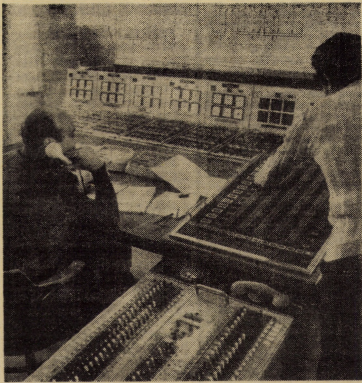
Asigurarea continuității în alimentarea cu energie electrică a consumatorilor — o sarcină permanentă, de mare răspundere, a secției de distribuție județeană de la întreprinderea de rețele electrice Sibiu. În fotografie: camera coordonatorului de manevre.

Nava cosmică „Sofuz-40”, cu echipaj comun româno-sovietic, și-a încheiat programul