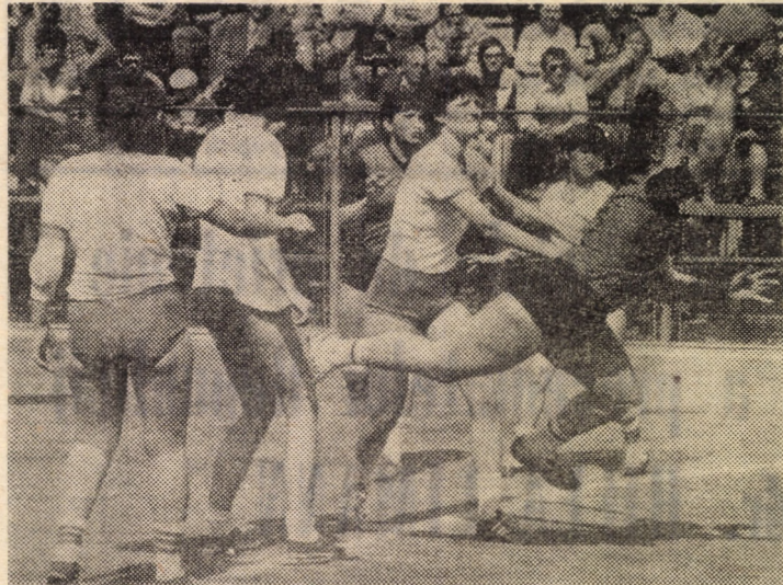
Fază din partida C.S.M. Sibiu — Chimica Arad

Gazdele au realizat una din partidele cele mai slabe din acest campionat în fața uneia dintre cele mai slabe echipe din serie. Explicația s-ar putea afla în tentația de a face economie de efort în fața unei adversare modeste, cu jucători având gabarit de copile, fapt care motivează în plin situația acestora în clasament, dar nu și faptul că un lider autoritar s-a coborât la nivelul lor de joc. Nu-i mai puțin adevărat că sibienii au avut foarte puțin mingea, arădențele lungindu-și atacurile până la limita pasivității, dacă nu și dincolo, însă aceasta numai cu concursul unui cuplu de arbitri slab, care a încurajat un atac fragil și a