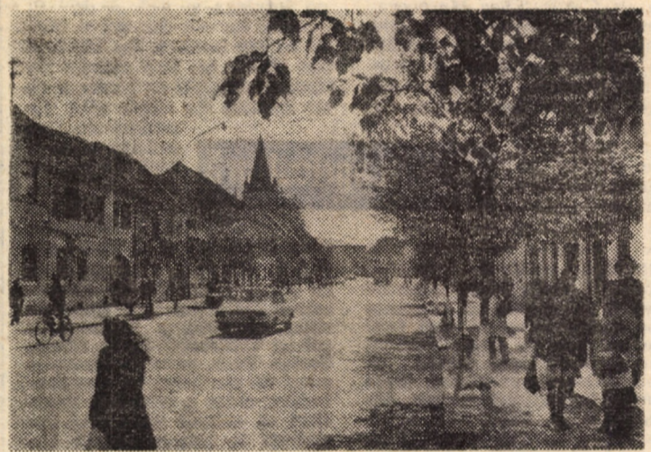
Prin grija cetățenilor și a edililor orașului, Cîsnădia se numără azi printre localitățile cu străzi curate și bine întreținute.