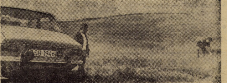
Cu mașina personală la „strîns” lucernă din parcela obștii