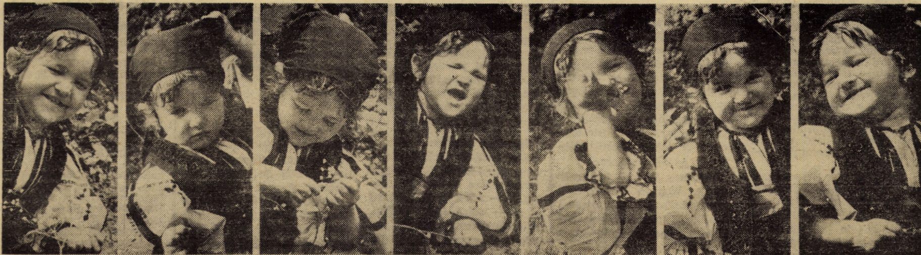
- Dacă sînt artistă? Nu știți? Vai de mine! Să cînt, să nu cînt? Ei, atunci, ascultați! Vai ce floare are mama! Ați văzut? Păi, cum altfel!