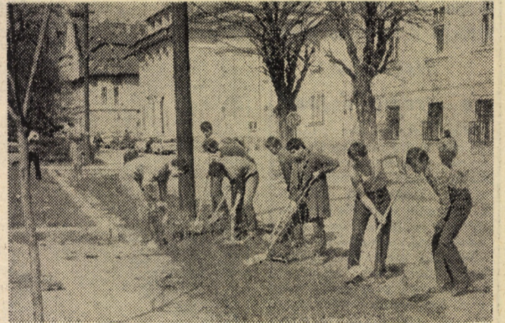
Cu hîrnicie și elan tineresc, elevii clasei a XI-a B a Liceului de matematică-fizică nr. 1 Sibiu, amenajează zona verde din Piața Schiller

„Haidatî voi fetele mele Să vă învăț doinele mele C-oi muri, m-oi duce-n lume Doinile cui or rămîne?! I.O.N.