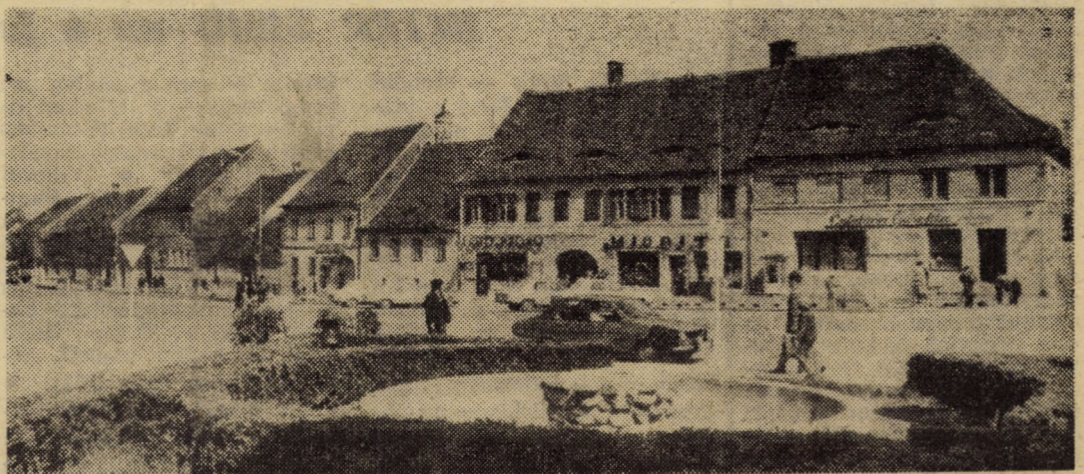
Centrul orașului Cisnădie, unde amprenta gospodarilor se vede cu prisosință.

Aceeași distincție a fost acordată organizației de tineret de la întreprinderea „Mecanică” Mirșă, care, la aceeași dată, a îndeplinit planul anual de muncă patriotică în proporție de peste sută la sută.