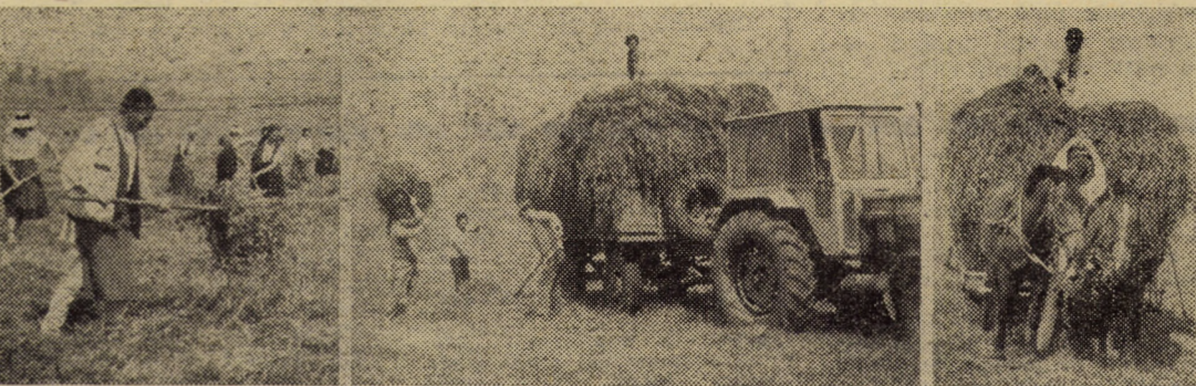
Secvență din amplul proces de strîns și depozitat furaje la C.A.P. Alțina