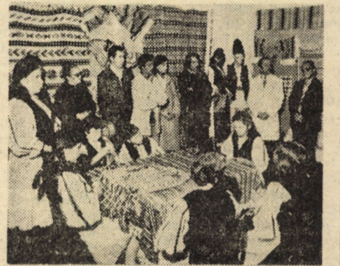
Una din nenumăratele expoziții cu produse de artă populară realizate de Maria Spiridon.