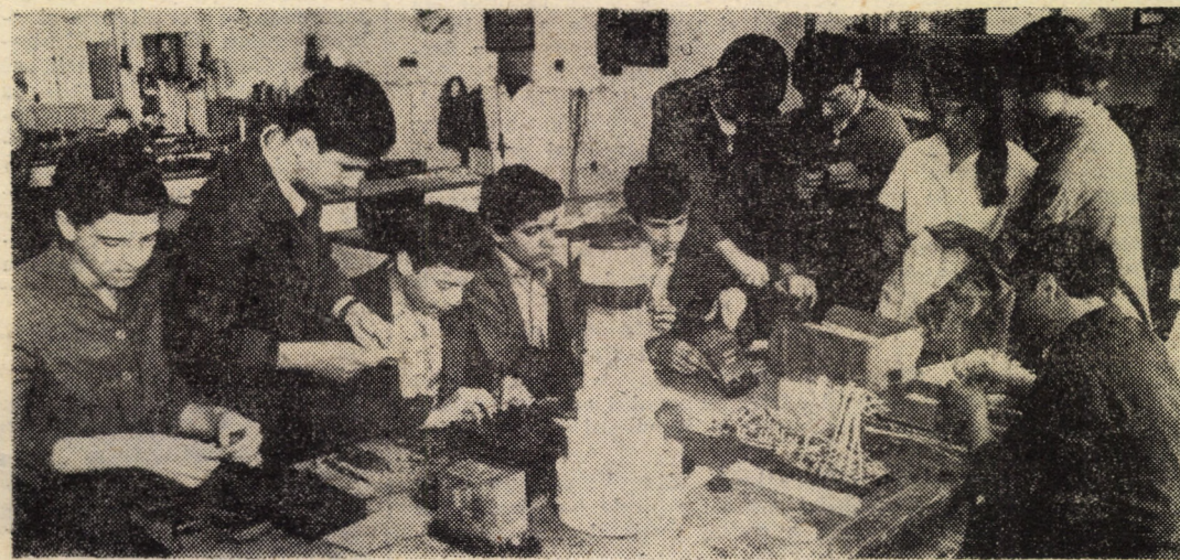
Timp de o săptămîină pe lună, elevii Liceului „Gheorghe Lazăr” din Sibiu efectuează practica în producție la ICEMENERG, filiala Sibiu, realizînd diferite produse a căror valoare — în anul școlar precedent — s-a ridicat la peste 145 000 lei. În foto elevii clasei a X F lucrînd în atelierul electric II