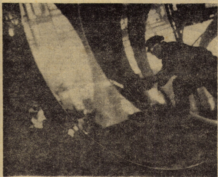
Din munca aspră, dar plină de satisfacții a cazangiiilor de la „Independența” Sibiu.

(Continuare în pag. a III-a) I. FLESCHEAN