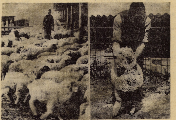
Imaginile de mai sus le-am surprins la saivanele de oi de la Hașag ale fermei I.A.S. Slimnic. Sînt berbecuți din rasa „Corriedale”, obținuți în acest an la sus-numita fermă și care au fost selecționați pentru reproducție. În general, oile din această rasă sînt crescute la noi pentru producția de lînă obținută. Dacă sînt bine întreținute — condiție esențială — acestea pot ajunge la niște performanțe inaccesibile pentru animalele din alte rase. Recordul de lînă obținută a fost în acest an de peste 10 kg și aparține unui berbec „Corriedale”.

— De la centrele de protecție a plantelor din Sibiu, Mediaș și Agnita. Pentru a evita aglomerațiile este recomandabil ca consiliile populare să împuternicească delegați pentru a le ridica.