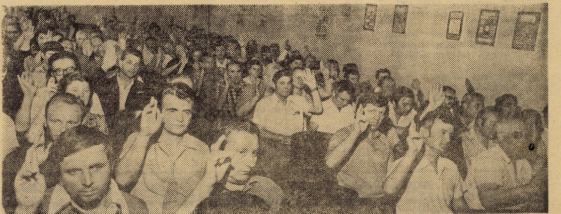
Aspect de la adunarea generală a reprezentanților oamenilor muncii de la „Independența” Sibiu.

În adunare s-au discutat și s-au ales candidații pentru Consiliul Național al Oamenilor Muncii, s-au reconfirmat delegații la Congres aleși în adunarea generală din februarie a.c. și s-au ales reprezentanții oamenilor muncii la conferința județeană.