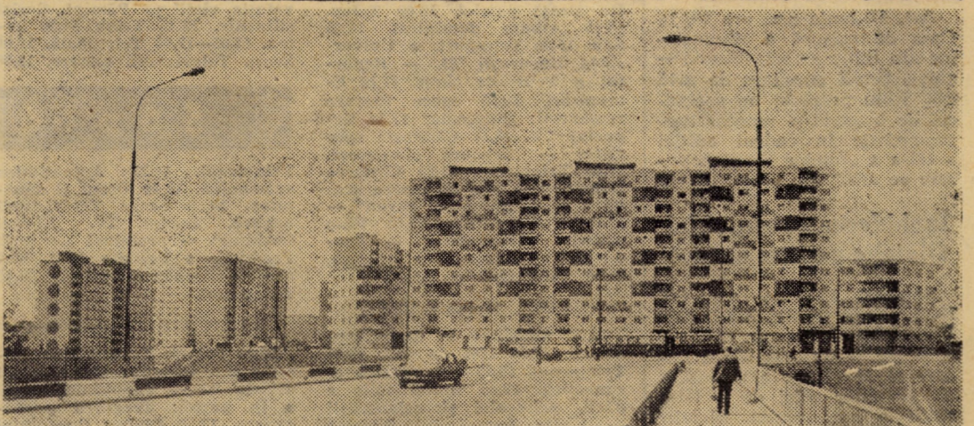
Noi construcții de locuințe ale cartierului „Vasile Aaron” din Sibiu. În centrul imaginii: blocul 48 cu 10 etaje

Aceste realizări sînt dedicate de harnicul colectiv medieșean apropiatului Congres al consiliilor oamenilor muncii.