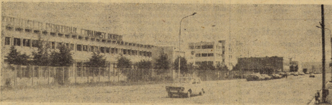
Vedere parțială a platformei industriale Sibiu — Est