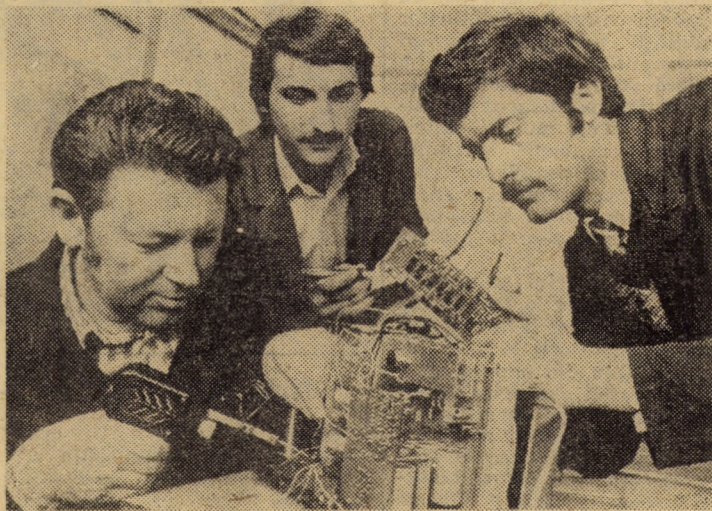
Recent, la Fabrica de relee Mediaș a fost înființat un atelier de metrologie în cadrul căruia se execută lucrări de reparații a aparaturii electronice de măsură și control

La întreprinderea „Emailul roșu” Mediaș s-a înregistrat o creștere cu 3,96 la sută a indicelui de utilizare a tablelor subțiri. În primele 5 luni colectivul atelierului a realizat din asemenea materiale 12,5 tone vase și peste 80 tone accesorii. Valoarea tablourilor economisite se ridică la aproximativ 500 000 lei.