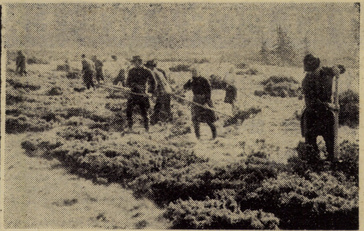
O echipă de muncitori efectuînd defrișări în „Șaua Bătrîna”

Nici dacă avea casă ar fi un palat, nici dacă cei în cauză s-ar dușmăni precum familiile York și Lancaster, asemenea înfrîngere, asemenea „bătălie” nu și-ar avea rostul. Oamenii în toată firea — o mamă bătrînă și doi copii care au trecut de prima tinerețe — se războiesc orbiți de pasiuni meschine, se tirăse prin sălile tribunalului, se jignesc în public și-ntr-o patru