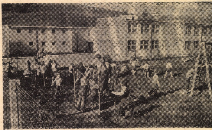
Copii la joacă, în curtea grădiniței de la I.M.C. Agnita