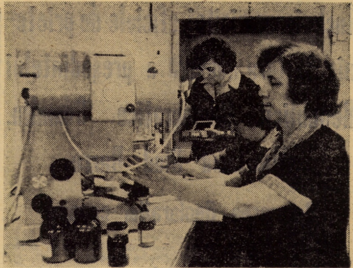
Printre multiplele probe, efectuate zilnic în laboratorul chimic al întreprinderii „Textila” Cisnădie se numără și stabilirea gradului de alb la fibrele de lînă — analiză ojutătoare pentru secțiile vopsitorie și creație

Anchetă realizată de ION SORESCU DUMITRU MANIȚIU