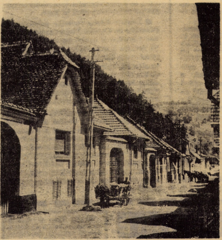
La Tilișca, oamenii și-au durat case noi, trainice, cum trainică le este dragostea față de glia strămoșească

Atitudinea profund ostilă a celor mai largi mase ale poporului român față de pus-tiitorul război nedrept, amplu concentrare de forțe realizată de Partidul Comunist Român împotriva pericolului care amenința însăși ființa noastră națională, au maturizat toate condițiile necesare trecerii la declanșarea revoluției de eliberare națională și socială, antiimperialistă și antifascistă, inițiată, organizată și dinamizată de Partidul Comunist Român.