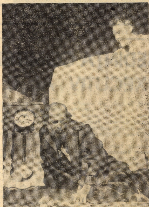
„Oedip salvat” de Radu Stanca