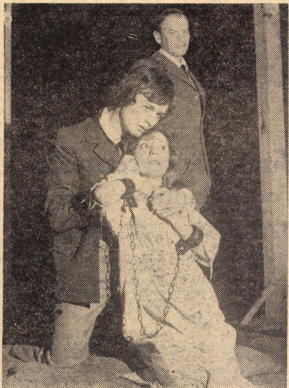
Scenă din spectacolul „Faust” de Goethe

Aș începe prin a releva eforturile pe care întregul colectiv le face pentru a adăuga elemente notabile la tot ce am realizat până în prezent. Un bilanț? 14 premii, cu care numai în anul 1981 am realizat un număr de aproape 300 spectacole pentru cei 20 000 de abonați și alți iubitori ai teatrului. Am fost, de asemenea, prezenți la festivaluri, simpozioane, și micro-turnee de gen, în centre de referință ale mișcării teatrale ro-