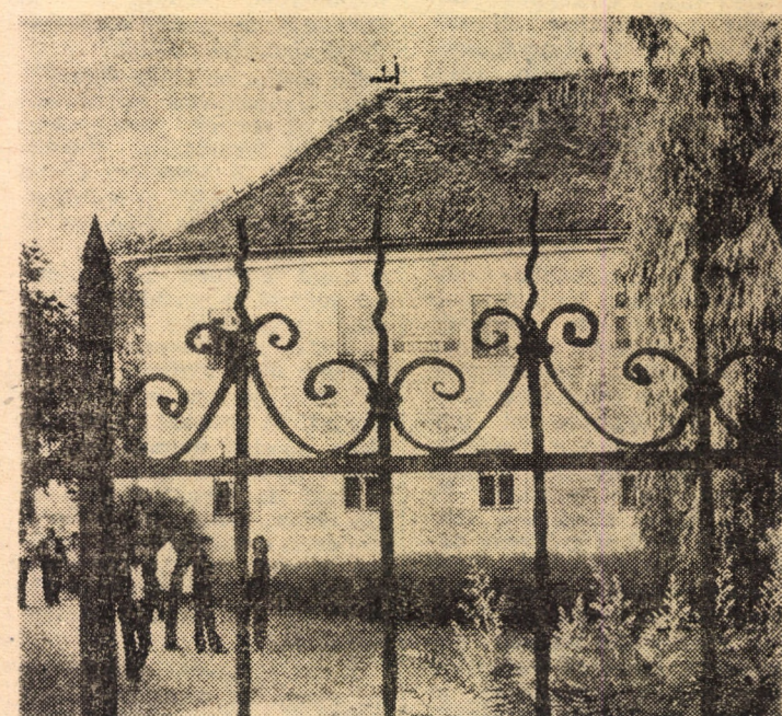
Muzeul municipal din Medias care a găzduit expoziția interjudețeană a Festivalului național „Cintarea României”, artă fotografică și artă plastică.