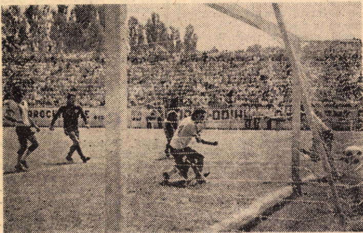
Imagine surprinzind marcarea celui de al II-lea gol din întâlnirea div. B de fotbal F.C. Șoimii-Petrolul Ploiești