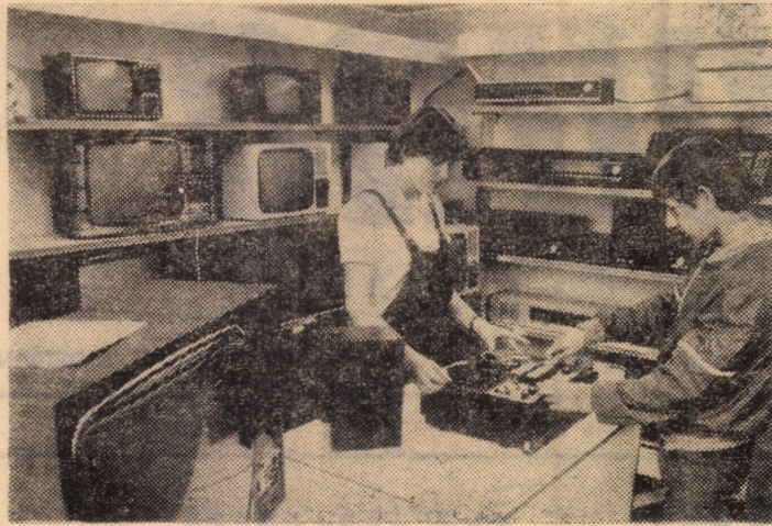
Aspect din magazinul „Electrice” din orașul Agnita