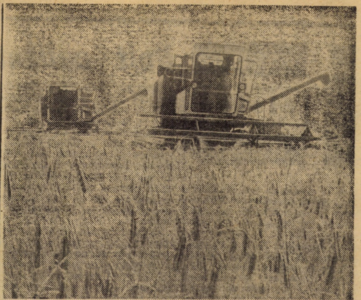
Înaintînd prin „marea de aur a belșugului”.

(Continuare în pag. a IV-a) ION ONUC NEMES