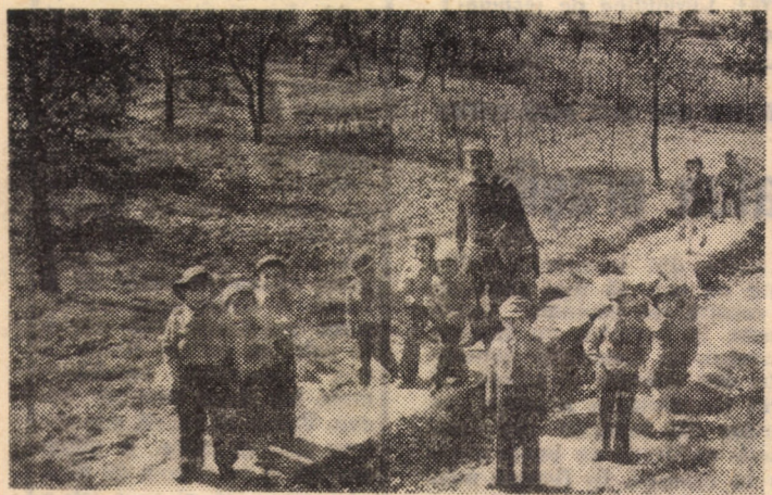
„Bobocii” de la grădinița întreprinderii de mînuși și ciorapi Agnita evadînd în pitorescul împrejurimilor orașului.