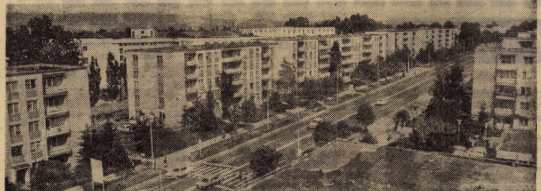
Vedere panoramică a cartierului Gh. Gheorghiu-Dej din Sibiu.