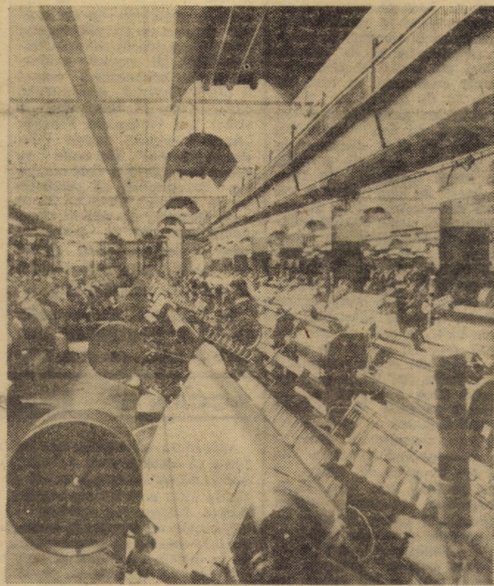
Tehnică de vîrf în industria textilă cisnădiană: sala mașinilor de țesut pneumatice.