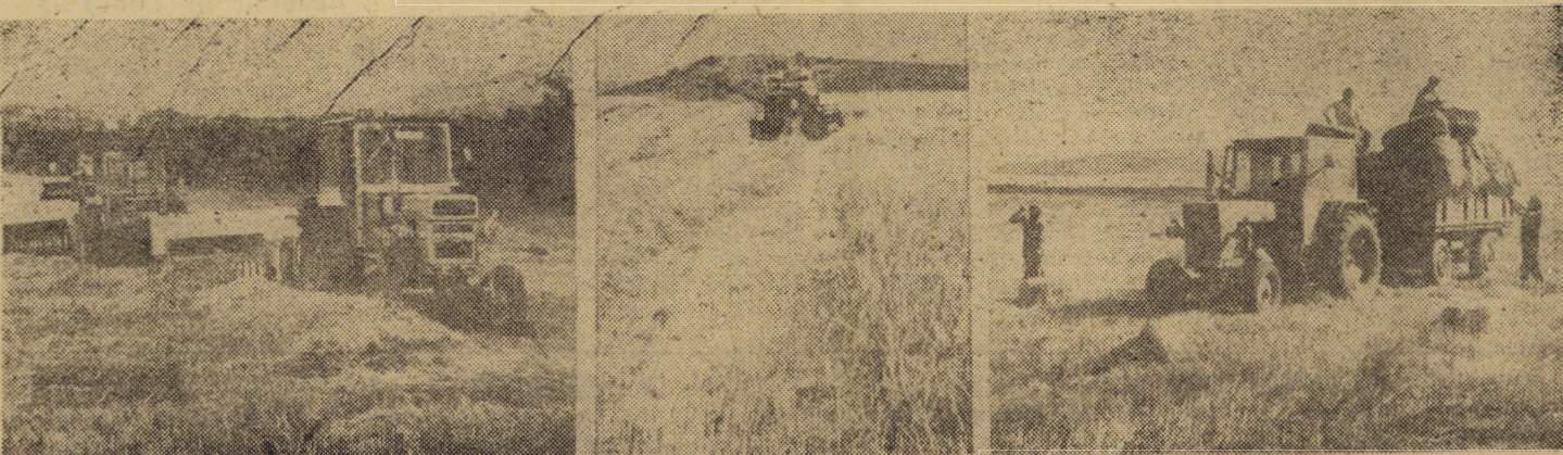
C.A.P. Armeni: secvențe dintr-o zi „plină”.

Paiele, care constituie, după cum subliniam și în alte împrejurări, un furaj foarte bun pentru animale, putem spune că în întreg consiliul au fost adunate de pe 252 hectare (din 651 recoltate), parțial fiind ridicate direct din brazdă și tocate pentru însilozare în amestec cu iarbă. Cît despre arături și însămintarea culturilor duble, au fost executate pe 120 ha (conform planului) în unitățile cooperatiste din Păuca și Broșteni, la C.A.P. Păuca porumbul fiind deja încolțit în fază de 3—4 frunze.