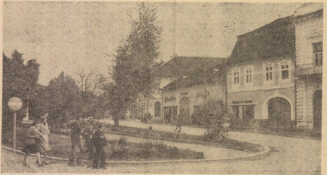
Ilustrată din centrul orașului Dumbrăveni