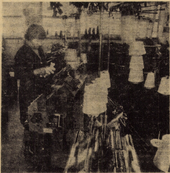
Întreprinderea de mînuși și ciorapi Agnita. Cu ajutorul mașinilor rectilini automate de tricostat — utilaje ale tehnicii de vîrf — se obține în prezent o mare varietate de produse, într-o bogată gamă coloristică, produse apreciate de beneficiarii interni și externi.