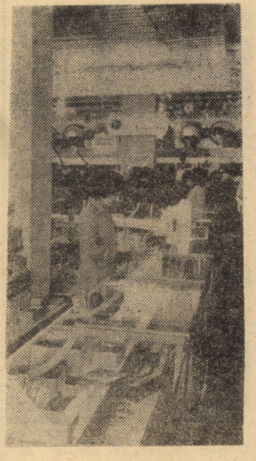
Raionul de papetărie și articole de scris al magazinului universal „Dumbrava” din Sibiu

9,30 10,10 (re 12,15 rat 12,35 Pod 13,00 ral 18,35 lib 18,55 19,00 19,30 Rej 19,55 dia 20,40 „Da dul 21,30 ver VI- 22,45 Sp SIB „Tolis rului” 13,45 20,30 Inchis 14,30; și 20 „Braț rele „Dete rele depen secol 10; 10 iemb mare” 18 și ME sul: extrat 9; 11 18,15 retulu nă” 18,30 Carag „Fulg rele Gră „Răz roz” CIS S”, c 18,30 AGI minur 18 și AP „Prun ardel 20 OC „Prun ardel 20. AV tul” TĂ pentr le 10 COPS ba d le 10 din Ex 8; 55 43; 7 Ex 37; 4 20; m (met Pe prev dura varia aver solit cări va s sud-v rile cupr 13 max 26 g