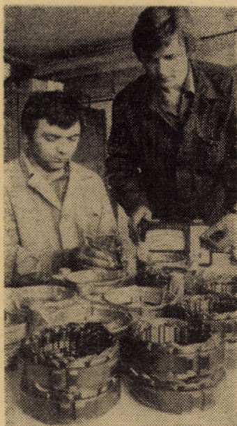
O preocupare generatoare de importante economii: reconducerea alternatoarelor la „Dacia-Service” Sibiu

Locurile libere la treapta a II-a (clasa a XI-a) pe profile, la 15 iulie 1981.