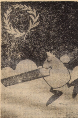
Desen de RUDI SCHMUCKLE