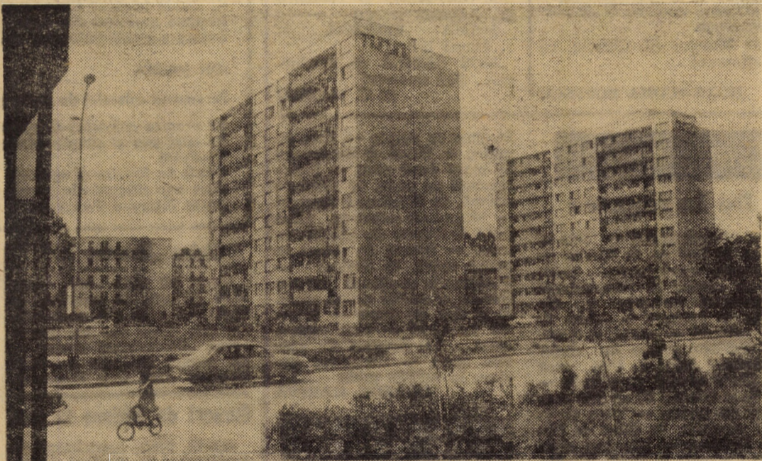
Pe Bulevardul Mihai Viteazul din Sibiu

Probele și verificările tehnice minuțioase executate pe standurile de probă au demonstrat că acest arzător funcționează la parametrii care depășesc cu sută la sută fenomenele meteorologice (mai mici sau mai mari) ale lunii iulie. (D. Gogălea).