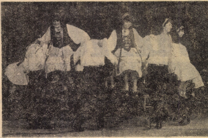
Formația de dansuri populare germane a Institutului de învățămînt superior Sibiu

GIMNASTICA ÎN PRODUCȚIE constituie o formă organizată de practicare zilnică, la locul de muncă, a unor complexe de exerciții fizice selecționate și preluate după o anumită metodă, ținînd seama de specificul de producție, în vederea întăririi sănătății, asigurării unei corecte dezvoltări fizice a oamenilor muncii, refacerii și creșterii capacității lor de muncă. Acest tip de mișcare, cu un rol deosebit în creșterea productivității muncii, este favorizat de caracteristicile pe care le prezintă: ● este accesibilă oricărei categorii de vîrstă și sex; ● se