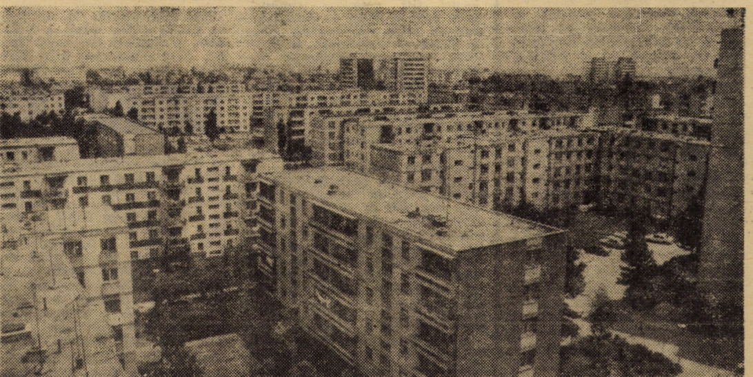
Vedere panoramică a cartierului Hipodrom I din Sibiu

ta la cheltuielile materiale. Concomitent cu reducerea cheltuielilor de producție, productivitatea netă a muncii a înregistrat față de plan o depășire de 6,1 la sută. Ambele performanțe se regăsesc firesc în îndeplinirea în proporție de 105,5 la sută a beneficiului planificat.