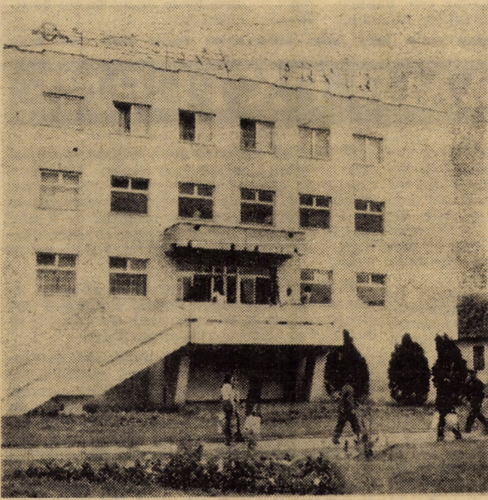
Complexul „Dacia” din Agnița se impune acum nu numai ca prezentă arhitectonică ci și ca un prețios edificiu de servire a populației