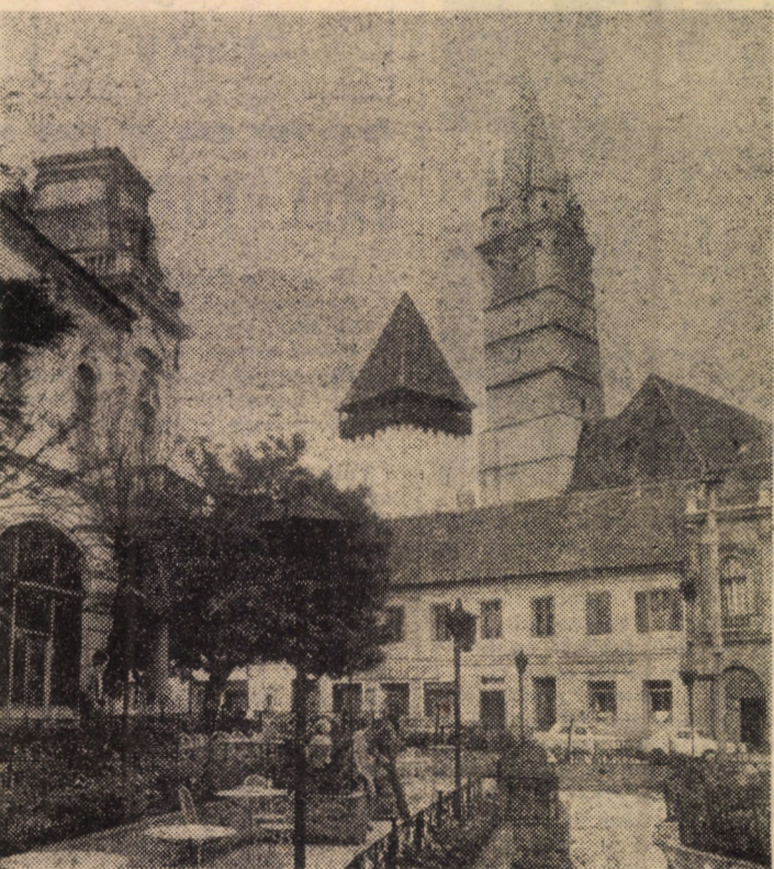
În plin sezon estival imaginea fotoreporterului nostru Fred Nuss se vrea o invitație pentru o vizită a municipiului de pe Tîrnava, semnificativă simbolică a istoriei (vezi fotoarhiv) cu o dezvoltare contemporană impetuoasă

ne de cercetare cele mai apropiate de locul accidentului, cerînd întocmirea de acte cu privire la cauzele și împrejurările accidentului și la pagubele provocate. Să ia măsuri pentru limitarea pagubelor, să înștiințeze neîntîrziat, despre producerea accidentului, organizația de asigurare, respectiv biroul asigurărilor de autovehicule din țara în care s-a produs accidentul, menționate în documentul internațional de asigurare primit, precum și Administrația centrală a asigurărilor de stat.