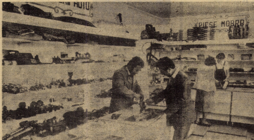
Agnita - spații comerciale moderne - însemne ale impetuasei dezvoltări a localității