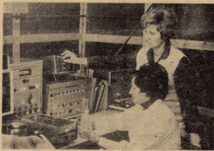
La asigurarea unor produse de calitate superioară își aduce aportul și colectivul laboratorului de spectrofotometrie al întreprinderii „E-maiul roșu” Mediaș unde sînt determinate elementele constituente și impuritățile din emailuri