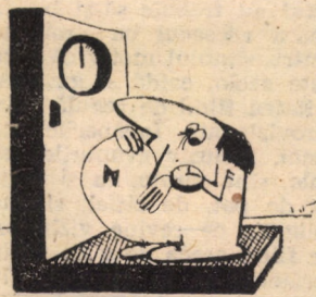
Fără cuvinte Desen de ADRIAN POPESCU