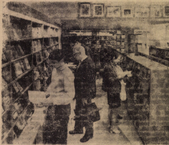
Librăria „Dacia Traiană”: ambianță plăcută în mijlocul cărților

Întrebare: Care sînt obligațiile ADAS la asigurarea de viață?