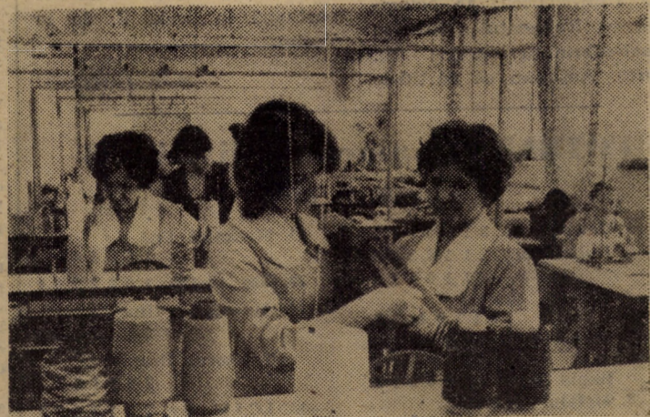
În cadrul Complexului pentru servirea populației al U.J.C.M. Sibiu, în noile ateliere de producție, dotate cu utilaje corespunzătoare, avînd condiții optime de lucru, se produce azi o mare varietate de articole de încălțăminte, satisfacînd pe deplin gusturile și pretențiile cumpărătorilor