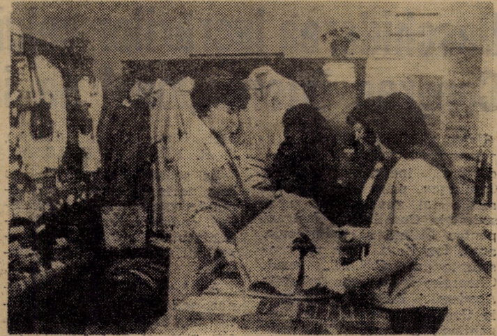
Prin unitățile sale de desfacere, cooperativa „Arta Sibiului” oferă azi o mare diversitate de articole artizanale, rod al contribuției permanente a creatorilor din această unitate.

Pentru o documentare tehnico-științifică adecvată, se impune imperios alcătuirea unui sistem județean de documentare, a unui centru, așa cum l-am mai propus, cu planuri în detaliu, încă din anul 1968. Consiliului județean al sindicatelor. Gîndesc ca acest centru să se organizeze în cadrul Casei de cul-