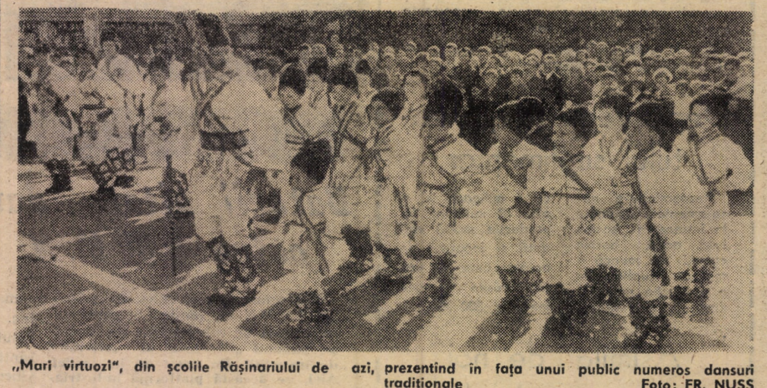
„Mari virtuozii”, din școlile Rășinariului de azi, prezentînd în fața unui public numeros dansuri tradiționale.

● În cadrul etapei județene a Campionatului național de orientare sportivă, desfășurată în zilele de 21-22 august în pădurea „Dumbrava II” de la marginea municipiului Sibiu, au fost desemnați campionii județului nostru ce ne vor reprezenta în finala pe țară, ce va avea loc în perioada 5-12 septembrie în