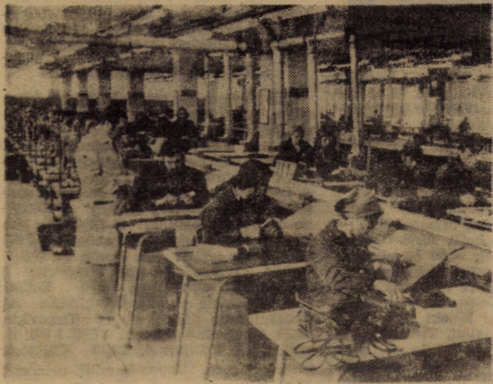
Imagine de la una din benzile de lucru ale unității de marochinărie de la Săliște, a întreprinderii „13 Decembrie”

(Continuare în pag. a III-a) ing. ILIE GH. IONESCU