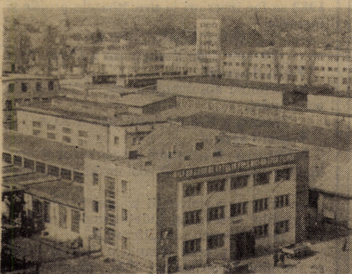
Vedere parțială a zonei industriale a „orașului de jos” din municipiul Sibiu