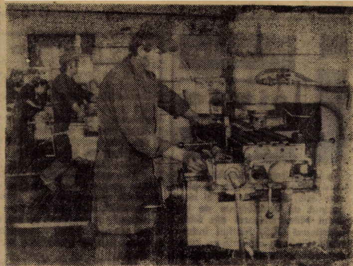
Prin reamplasarea unor utilaje în atelierele de bază de la I.U.P.S. Sibiu, spațiile productive sînt folosite cit mai rațional, îmbunătățindu-se totodată fluxul tehnologic al producției. Iată - în fotografie - un grup de mașini într-o amplasare judicioasă, reprezentînd linia de prelucrare prin frezare a cuștelor pentru industria lemnului