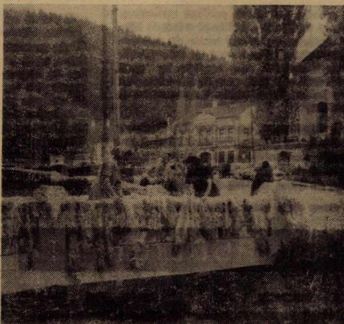
Schimbînd o vorbă, ca între vecini, lingă darul de preț al mișoarelor...

Există, deci, în aceste unități toate condițiile pentru ca recoltările de toamnă, semănatul și celelalte lucrări să se realizeze la termenele stabilite. (N.B.)