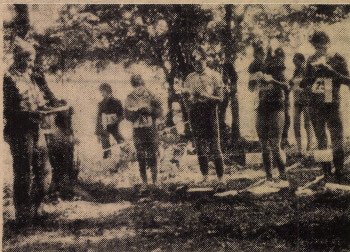
Într-o organizare ireproșabilă, asigurată de comisia județeană de turism și alpinism de pe lângă C.J.E.F.S. Sibiu, duminică, în pădurea Catriana, de lângă Căsnădioara, s-a