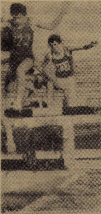
Sport (pag. a II-a)

Realizarea cu un substanțial avans a programului de utilare a fabricilor de zahăr reprezintă încă un examen tehnic major trecut cu succes de binecunoscuta întreprindere sibiană.