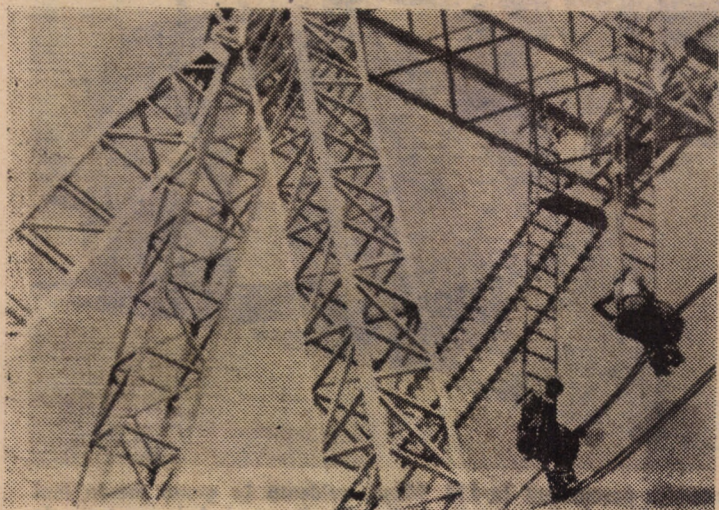
„Cavalarii curajului” la lucru

9,00 Telescoala. 10,00 Festivalul „Enescu — orfelul moldav” — Ediția a II-a. Tescani 1981. 10,25 Omul și sănătatea. 10,45 Roman foileton. Vîntul speranței. Reluarea episodului 2. 11,40 De la operetă la musical. 12,20 Munca politico-educativă: inițiativă, eficiență. 12,45 Telex.