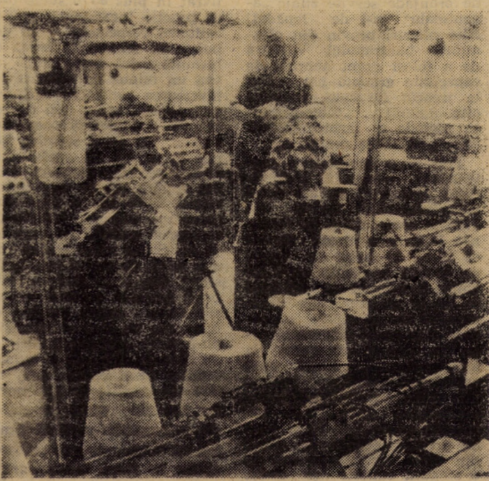
Mășini de bază din secția fricotat mînuși — utilaje complexe cu ajutorul cărora se obține azi o gamă variată de modele, cerută de beneficiarii întreprinderii de tricotaie Agnita