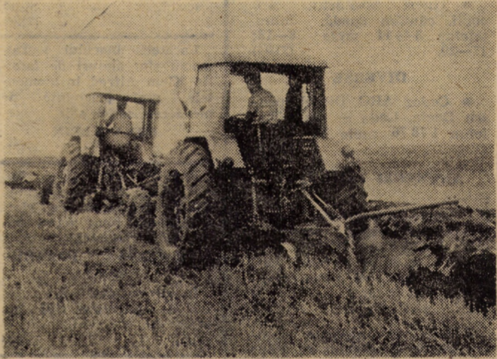
Tractoare în formație de lucru — întorc brazdă nouă în terenul eliberat

Sînt acestea doar câteva idei, fapte și aspecte care pledează pentru creșterea și diversificarea complexului proces care este tipizarea producției, pentru îndepărtarea practicilor birocratice din acest important domeniu al progresului tehnic.