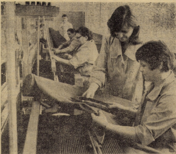
În numeroase colective, forța de muncă feminină este o prezență nu doar... estetică, ci una care înseamnă hărnicie, devotament, profesionalism