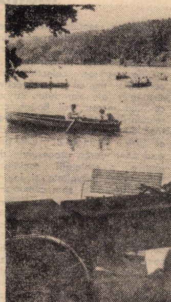
Parcul de agrement din Dumbrava Sibului - un loc atrăgător și reconfortant

a șatrei, unde Secărică devine Șan, adică stăpin înțelept și cumpătat descins parca dintr-o mitologie străveche - și unde țiganii trăiesc „ca-n sinul lui Avram“ iar Huțanu primește in locul protezei greoaie din plastic una „electrică cu contragreutăți“, descrierea acestei experiențe, deci, fac din „Ultimul paradis“ o bună povestire fantastică, sau o originală infuzie de fantastic in romanul Feliciei atit de prozaic și atit de copleșit de concret. Căci Felicia nu va evada din datele personalității sale și nici din concretul imediat. Marcată de experiența cu Marcel, eroina își va trăi ultima ei aventură: căsnicia cu Ștefan Vornicu, „inginer la una din uzinele Piteștiului“. Conflictul va avea, de-acum, o evoluție previzibilă, cum indeobște se