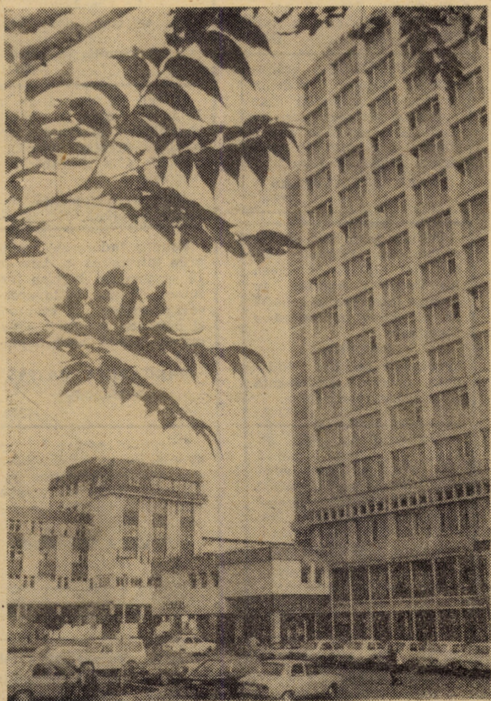
Urbanistică modernă în centrul Sibiului