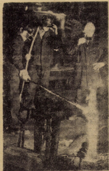
Elaborarea unei noi șarje de oțel la turnăria întreprinderii „Independența” Sibiu