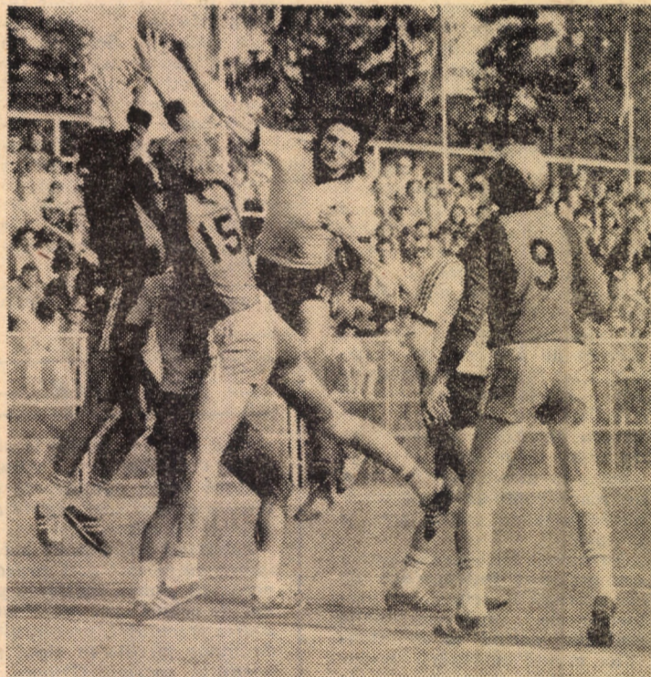
Birtalan „detonînd” o minge ce va magnetiza aproape totul: priviri, brațe de apărători, pînda propriului pivot. Mai puțin pe portar, pe lângă care mingea va trece ca o nălucă...

Etapa viitoare: Min. Vulcan — Min. Paroșeni; Met. Cugir — Textila; CPL — Min. Ghelar; Lotrul — Victoria Călan; C.F.R. — Min. Aninoasa; Explormin — IMIX; Mecanica — Automecanica; Vitrometan — Min. Certej.