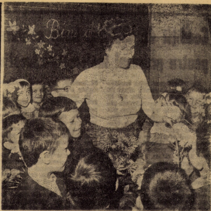
Cele mai gingașe flori ale țării rămin, totuși, copiii, zîmbetul lor pur și privirea limpede semnificând o nețărmurită încredere în viitor