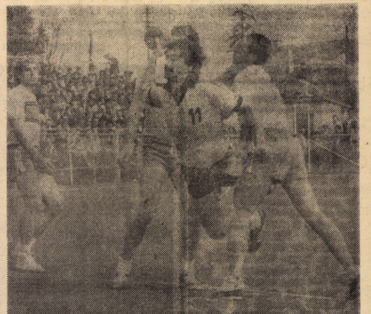
Tilvic pătrunzînd cu tehnicitatea-i recunoscută printre doi resiteni ce pot servi de model de apărare corectă