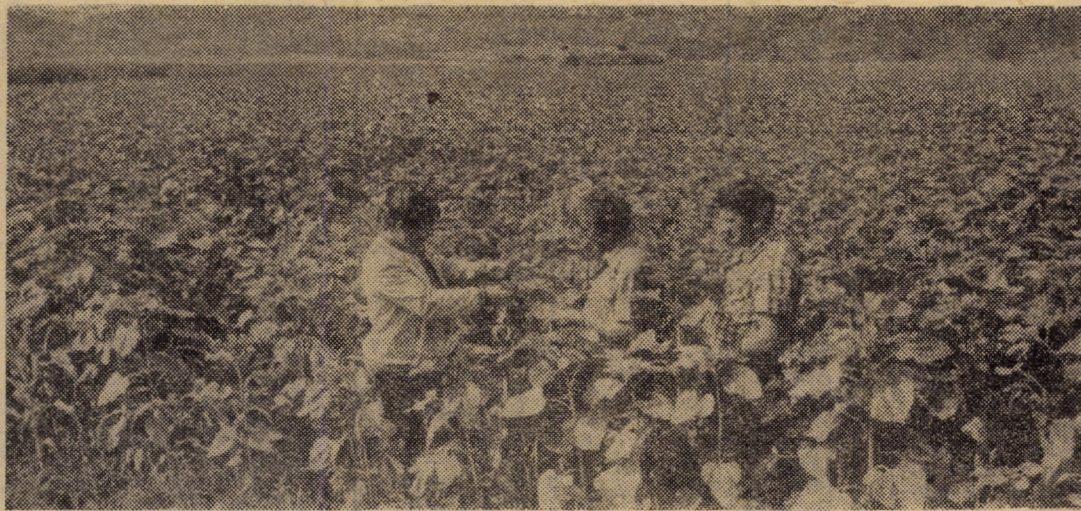
Cultură dublă de floarea-soarelui în amestec cu porumb la C.A.P. Cristian unde se obține o producție medie de 30 000 kg masă verde la hectar

(Continuare în pag. a III-a) NICOLAE ACHIM