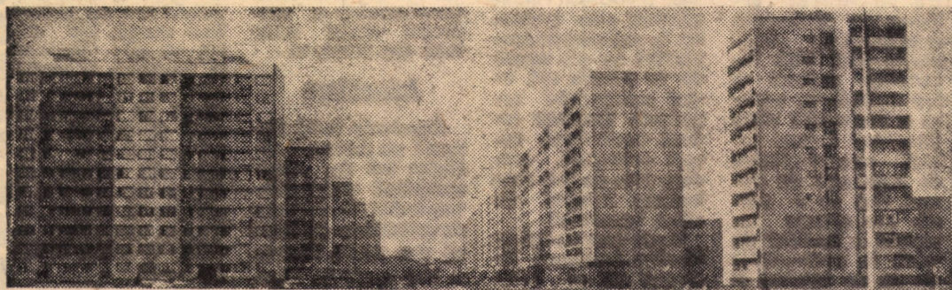
○ magistrală sibiană contemporană