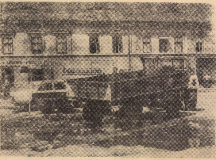
O notă discordantă față de măsurile de infrumusețare a municipiului Sibiu o reprezintă (încă!) locul de intersecție a străzilor 9 Mai, Karl Marx și Faurului

9,00 Muzică populară. 9,20 Integrala Shakespeare. Henric al IV-lea. 11,50 Capodopere — mari interpreți. 13,00 Mozaic cultural — artistic — sportiv. Sport: Fotbal: Steaua — Universitatea Craiova, (divizia A), transmisiune directă de la București. 18,30 Septembrie — cronica evenimentelor politice. 18,50 1001 de seri. 19,00 Telegazeta. 19,30 Călătorie prin țara-mea. 20,00 Telegazeta. 20,50 Film serial. Sfidarea. Ultimul episod. 21,45 Portativul vesel. Fantezie muzical-coregrafică. 22,30 Telegazeta. • Sport.