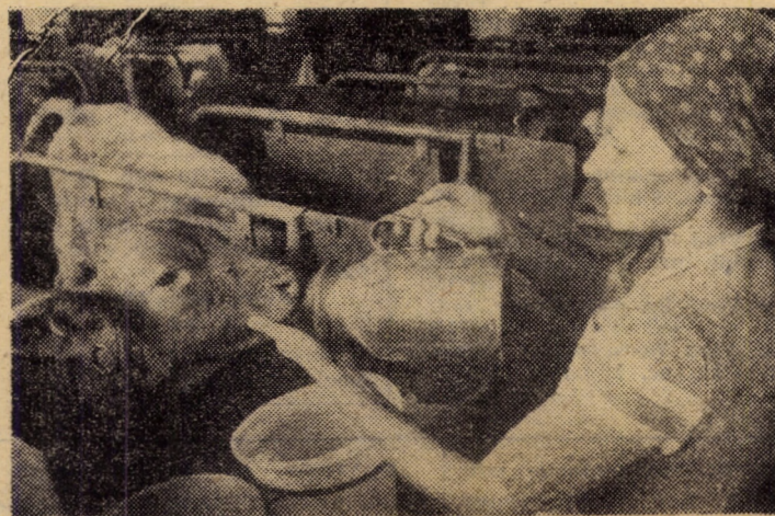
În creșele fermelor zootehnice se acordă o atenție deosebită îngrijirii corespunzătoare a viteilor