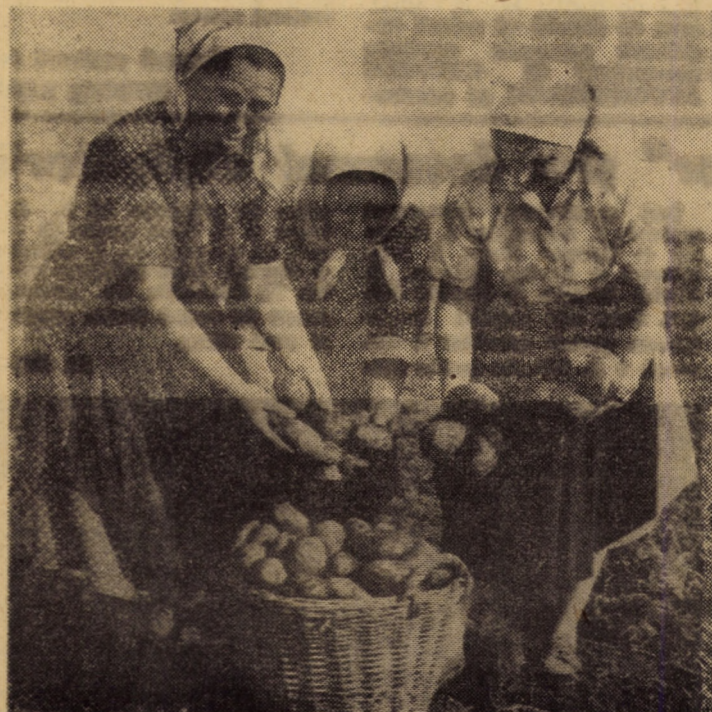
C.A.P. Loamneș, brigada Mîndra - În fotografie am surprins un grup de cooperatoare care se pot mindri cu roadele muncii lor