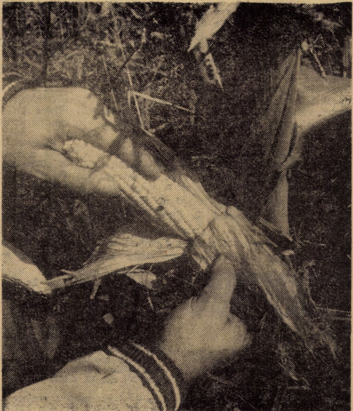
Toamna la ceasul cînd se coace porumbul...

Cît privește semănăturile la păioasele de toamnă, orzul se află sub brazdă, iar grîul doar pe 82 ha (!) din 1 460 ha planificate. E drept că în ultimele zile se resimte eficiența unor măsuri organizatorice, în creșterea ritmului de arat, pregătirea teren și semănat cu 20 la sută, ca urmare a organizării schimburilor prelunge și a dirijării utilajelor disponibile din S.M.A. în proporție de 75 la sută pentru aceste lucrări. Este insuficient însă,