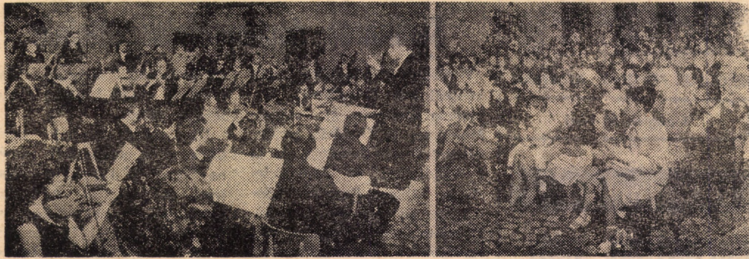
Concertul simfonic din curtea Muzeului Brukenthal